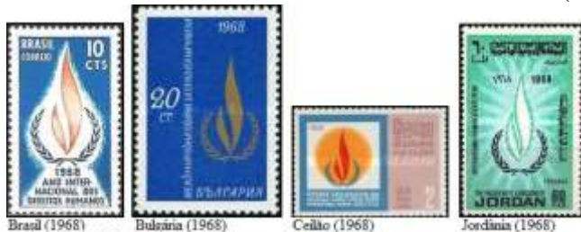
Brasil (1968) Bulgária (1968) Ceilão (1968) Jordânia (1968)