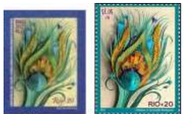
Brasil (2012) - Nações Unidas [Nova York] ($ 1.05).

Ano 2012 - Conferência Rio+20-Pena de pavão (RHM C3214):