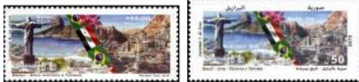
Brasil (2010) Síria (50 P).

Ano 2010 - Relações diplomáticas Brasil-Síria [História e Turismo] (RHM C2983):