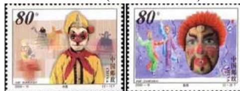
República Popular da China (2000)

Ano 2001 - Conferência mundial contra o racismo (RHM C2405):