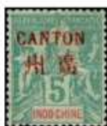
Navegação e comércio (1892-1907)