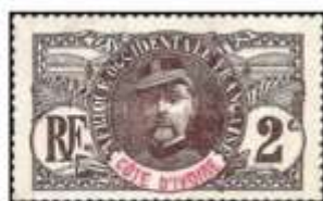
General Louis Faidherbe (1906-1907)