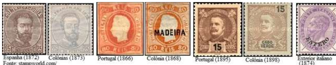
Espanha (1872) Colônias (1873)

Na segunda metade do século XIX e primeira metade do século XX, Alemanha, Bélgica, Espanha, França, Grã-Bretanha, Holanda, Itália e Portugal possuíam territórios ultramarinos (colônias, escritórios e ocupações) e produziram, para uso em seus territórios, selos (ultramarinos) semelhantes aos utilizados internamente ou selos internos com sobrecarga do nome do território.