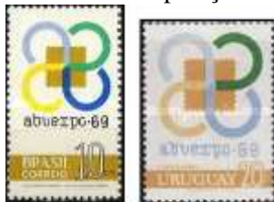
Brasil (1969) Uruguai (1969)