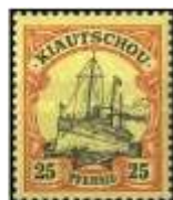
Navio Hohenzollern (1900-1916)