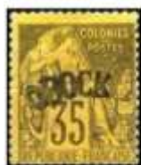
Porte colonial (1881-1892)