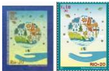
Brasil (2012) Nações Unidas [Genebra] (F.S. 1,40).

Ano 2012 - Conferência Rio+20-Mão apoiadora (RHM C3213):