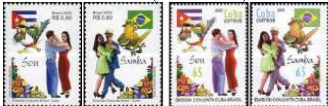
Brasil (2005)