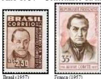
Brasil (1957) Fonte: stampworld.com/ - França (35 F).

Ano 1957 - Centenário da morte de Auguste Comte (RHM C0395):