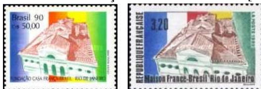
Brasil (1990) França (1990)