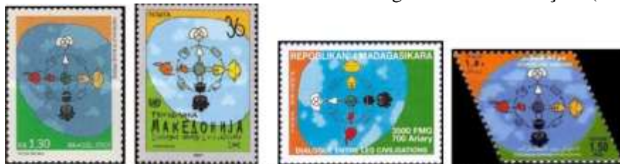
Brasil (2001)