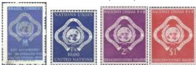
Brasil (1970) Nações Unidas [Genebra] (1970) Nações Unidas [New York] (1951)