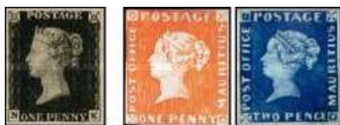
Penny Black (1840) Mauritius Post Office (1847)

Em 1847, as Ilhas Maurício se tornaram o 4º emissor mundial de selo, para franquia válida em todo território, lançando os selos “Mauritius Post Office”, cuja estampa é similar ao Penny Black (primeiro selo mundial, lançado pela Grã-Bretanha em 1840).