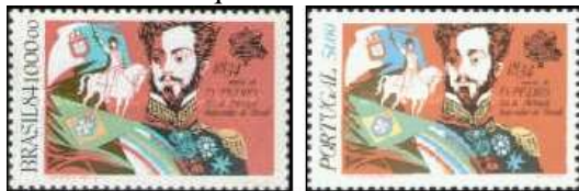
Brasil (1984) Portugal (1984)