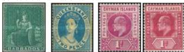
Britânia (1849-1882) Rainha Victoria (1851-1895) Rei Edward VII (1903-1912)