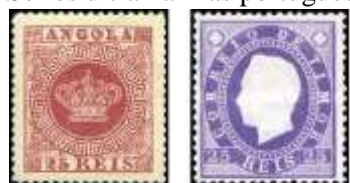
Coroa (1870-1885) Rei Luiz (1866-1915)