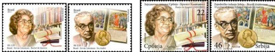
Brasil (2011) Fonte: stampworld.com/ - Sérvia (46 Din; 22 Din).

Ano 2011 - Relações diplomáticas Brasil-Sérvia [Literatura] (RHM C3148/9):