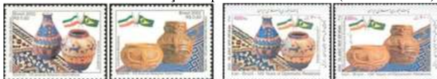
Brasil (2002)