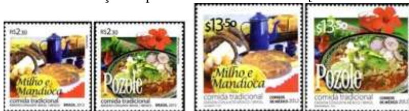
Brasil (2012) - México ($ 13.50; $ 13.50).

Ano 2012 - Relações diplomáticas Brasil-México [Comidas tradicionais] (RHM C3215/6):