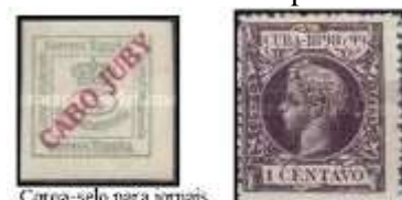
Coroa-selo para jornais (1872-1922) Rei Afonso XIII (1898-1910)