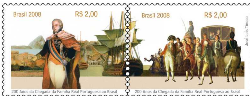
200 Anos da Chegada da Família Real Portuguesa ao Brasil (RHM C-2721-2722)

Em 22 de janeiro de 1808, com o apoio de quatro navios ingleses, a comitiva portuguesa, que ocupava dezesseis embarcações, chegava a Salvador.