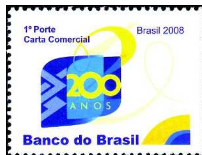
200 anos do Banco do Brasil (RHM C-2725)