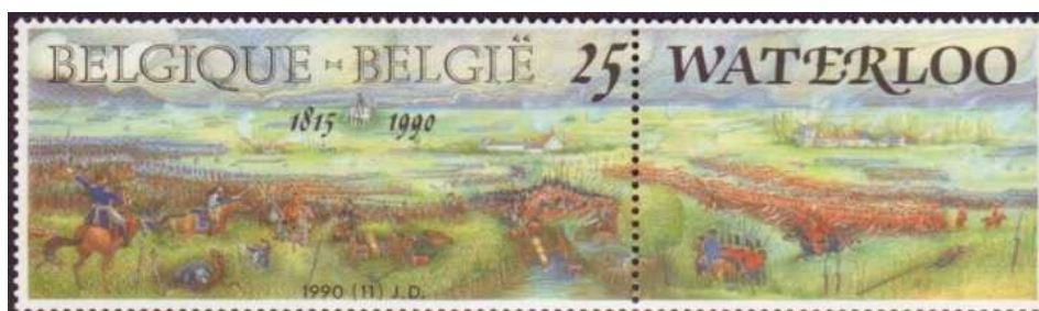
175 Anos da Batalha de Waterloo – Emissão belga de 16 de junho de 1990

As guerras napoleônicas se encerraram de forma definitiva em 18 de junho de 1815, quando Napoleão encontrou sua derrota final na Batalha de Waterloo, sendo vencido pela coalizão da Inglaterra (liderada por Arthur Wellesley, o "Duque de Wellington) com a Prússia (comandada por Gebhard von Blücher).